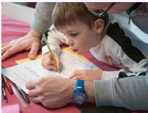
Une famille confinée à Mulhouse (Haut-Rhin), mardi.