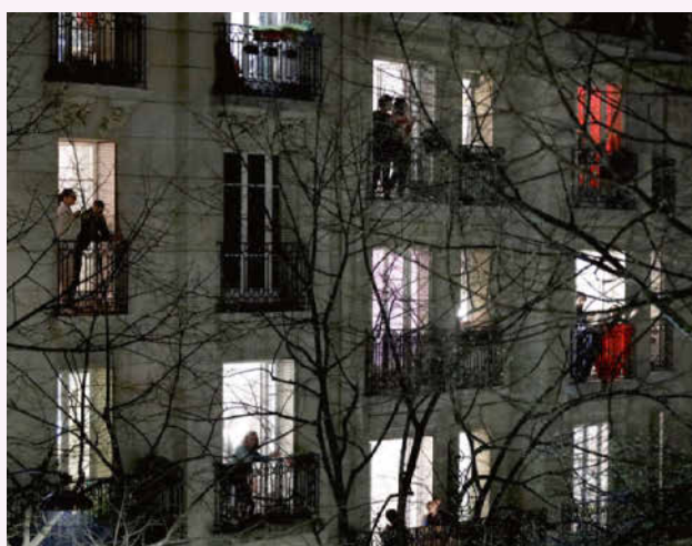
Personnes confinées, sur leur balcon, mercredi soir, à Paris.

Le Petit Quotidien te propose maintenant de participer à 3 concours de dessins, de photos ou de vidéos.