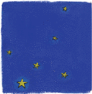
Constellation du Cygne

6. Comment se nomment ces constellations célèbres ?