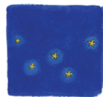
Constellation de Cassiopée

9. Retrouve les mots suivants dans la grille :