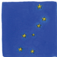
Constellation de la Grande Ourse